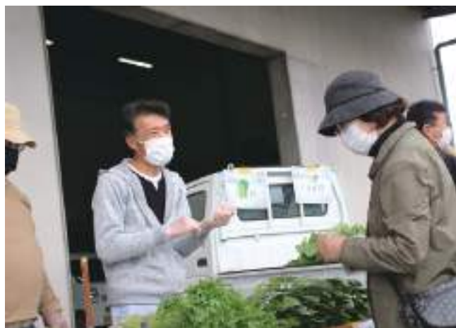
新鮮野菜を販売する委員

生産量日本一を誇る柏市産小かぶのPRと、農住混在の中で行われている都市農業への理解促進を目的として始められた直売会も、今回で5回目を迎えました。販売する野菜の品目も当初は「小かぶ」のみでしたが、今では19品目に増え、「わさび菜」など珍しい野菜も販売するようになりました。朝採れた新鮮野菜をトラックから直接販売するなど、直売会は活気に満ちていました。