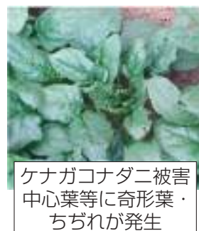
ケナガコナダニ被害 中心葉等に奇形葉・ ちぢれが発生