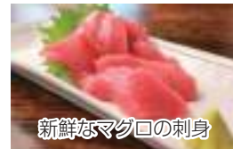
新鮮なマグロの刺身