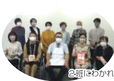
2班にわかれ、受講しました

今回は、予定していた公民館が使用できず、急遽会議室で実演のみでの開催でしたが、「よく使う材料で美味しく、いつもと違った料理が出来るなんて!」と皆さん喜ばれていました。