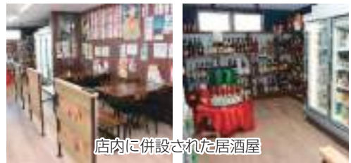
店内に併設された居酒屋