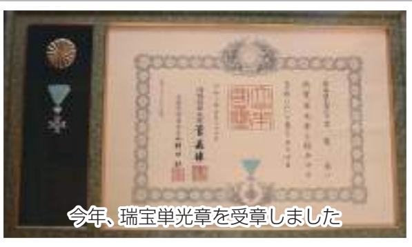
今年、瑞宝単光章を受章しました