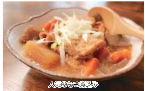
人気のもつ煮込み

カウンター席や一人席もあるので、ご自宅用のお酒も探しつつ、美味しいお食事もお楽しみしてみませんか？