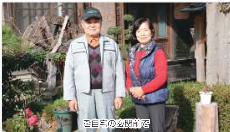
ご自宅の玄関前で