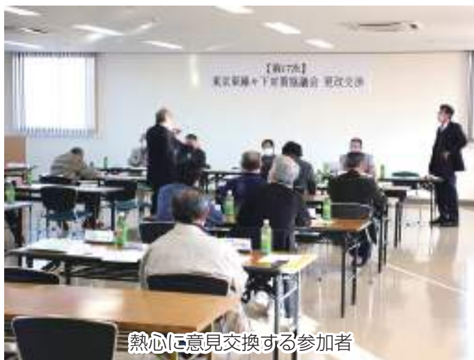
熱心に意見交換する参加者

東京東線々下対策協議会は10月29日、柏支店2階会議室で東電用地(株)と第1回更改交渉を行いました。